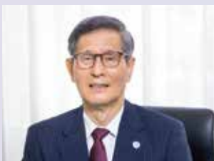
独立行政法人 地域医療機能推進機構 理事長 尾身 茂