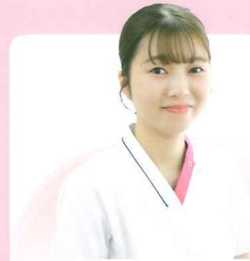
新人看護師 (プリセプター)