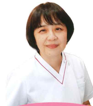
看護部長あいさつ

看護師の資格を取得しようとしている方で資格取得後、当院にて勤務を希望される方に対して奨学金制度を実施しています。 (返済免除制度有)