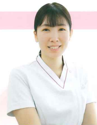
先輩看護師 (プリセプター)

整形外科病棟配属になった当初は、分からないことばかりで不安でいっぱいでした。しかし、プリセプターさんや部署の先輩方が常に気にかけてくださり、優しく丁寧に指導して下さっているおかげで楽しく働くことが出来ています。整形外科病棟では周術期の看護や入院の過程などを学ぶことが出来ました。出来ることが増えることで看護師のやりがいを感じることも多くなりました。今後も、患者さんと家族の気持ちに寄り添った看護を提供できるように取り組んでいきます。