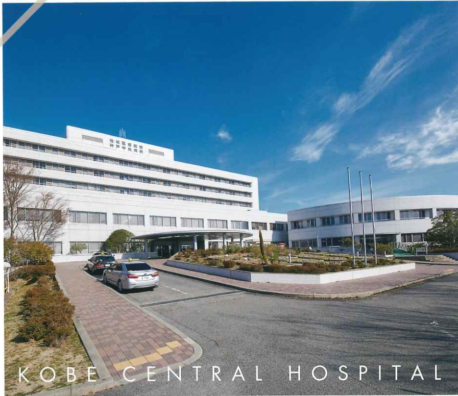
KOBE CENTRAL HOSPITAL