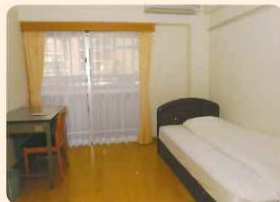
全室冷暖房完備 (寮)