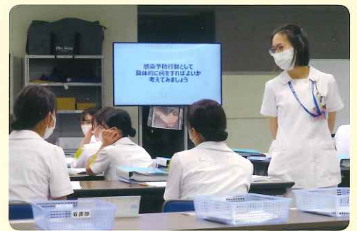
専門看護師からの講義