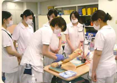
採血静脈注射モデルでトレーニングができます。