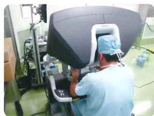
ロボット（ダヴィンチ）鏡視下手術を行っている様子