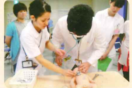
小児の気管内挿管のトレーニング中です。