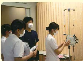
医療機器の取り扱い

*がん看護専門看護師からオレムのセルフケア理論について講義とグループワークを行います。 2年目に患者のもつかに注目した「セルフケア支援」の看護実践について事例をまとめ発表をします。