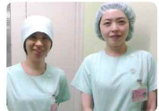
手術看護認定看護師の2人です

手術室は手術室13室と心臓カテーテル検査室、アンギオ室があり、毎日様々な症例が行われています。学生の時、実習などで手術室に入る機会が少ないため、どのようなことをしたら良いのか具体的にイメージがわかず不安だと思います。しかし、オリエンテーションからまず始めていき、わからないことはプリセプターや臨床指導者が全力でバックアップします！多科に渡る手術室では多くの疾患や解剖、そして病棟では経験出来ない手術看護など多くの事を学ぶことができる場所です。是非私達と一緒に頑張っていきましょう！！