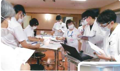
多職種でカンファレンスとラウンド