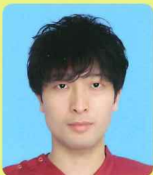
救急看護認定看護師

当院の救急センターでは、医師・看護師を含め、チームが一丸となり、相談しながら患者さんの回復という目標に向かって取り組んでいます。救急領域では看護ケアの結果が短時間で現れるため、一瞬も気が抜けないことが大変でもあり、楽しみ、やりがいでもあります。救急看護は看護の力を最大限に発揮できる分野です。一緒に救急看護師として頑張ってみませんか。