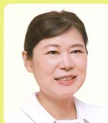
慢性疾患看護専門看護師

当院の救急センターでは、医師・看護師を含め、チームが一丸となり、相談しながら患者さんの回復という目標に向かって取り組んでいます。救急領域では看護ケアの結果が短時間で現れるため、一瞬も気が抜けないことが大変でもあり、楽しみ、やりがいでもあります。救急看護は看護の力を最大限に発揮できる分野です。一緒に救急看護師として頑張ってみませんか。