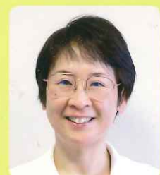
皮膚・排泄ケア認定看護師 (特定行為研修修了)

慢性疾患は、患者さんやご家族が毎日の生活の中で管理していかなければならない病気です。私は、患者さんが納得してまた安心して治療に取り組むことができるように、一緒に療養方法を話し合います。皆さんが出会う糖尿病やその他の慢性疾患患者さんの療養方法について、疑問や心配があればいつでもご連絡ください。必要な情報を提供したり、相談にものっていききたいと思います。