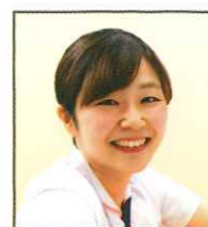
Sさん 回復期リハビリテーション病棟

入職当初から回復期リハビリテーション病棟で勤務をしていました。育休復帰後から手術室看護への興味と子育てとの両立を考え、手術室で勤務をしています。手術室看護は専門性も高く、両立が大変な事もありましたが、充実した教育体制と子育て世代に温かい職場風土に支えられてきました。現在は二人の子育てと両立しながら副看護師長として頑張っています。勤務体制が配慮されており多くの子育て世代が働いている、働きやすい職場です。