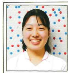
回復期 リハビリテーション病棟

患者さんのその人らしい生活を一緒に再構築していける看護師になりたいと考え、当院に入職しました。新人教育は個人のペースに合わせて実施され、確実にステップアップしていける環境です。ときには辛くて仕事に来たくない時もありましたが、臨床心理士や看護師長とお話をする中で救われ、メンタルケアも充実していると思います。まだまだ未熟ですが、思い描いた看護師像に近づけるよう毎日頑張っています。