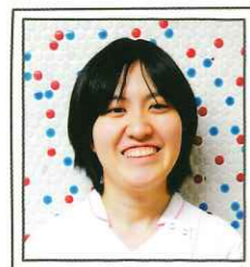
回復期 リハビリテーション病棟

回復期リハビリテーション病棟で勤務しています。病棟では患者さんのADL 拡大に向けて多職種と連携をとって援助を行っています。患者さんが日々、できることが増える喜びを共有し看護のやりがいを実感しています。プリセプターを始め、やさしい先輩方に指導していただき少しずつできることも増えています。これからも知識・技術を身につけ患者さんの個性に応じた看護ができるように努力していきたいと思っています。