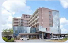
⑤ 福岡ゆたか中央病院