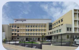
⑪ 天草中央総合病院