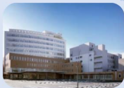
⑩ 人吉医療センター