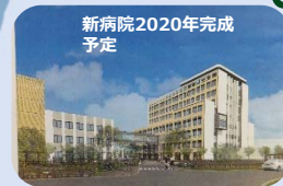
⑫ 南海医療センター