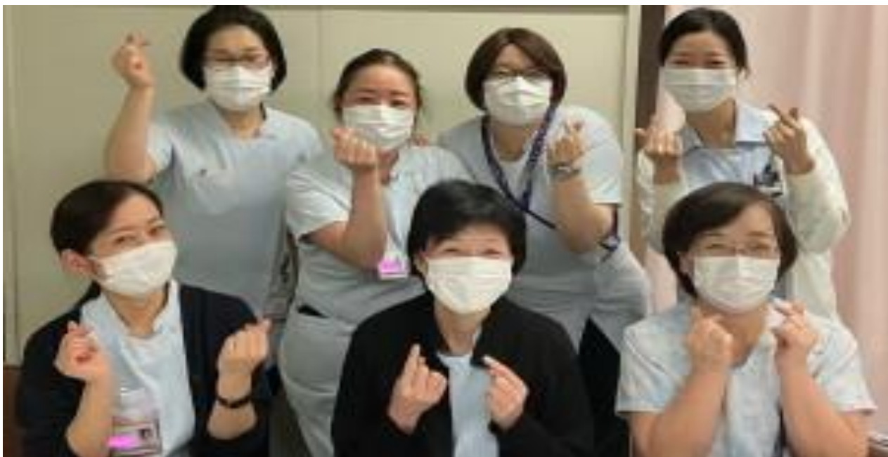
看護補助者同士和気あいあい♪