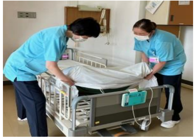
患者さんに合わせたベッドを作成します♪