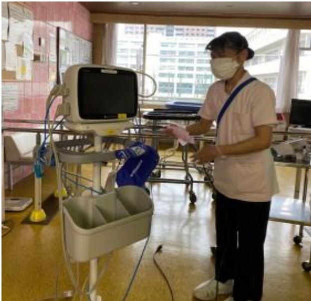
使い終わった機器を片付け、すぐ次に使えるように準備します♪