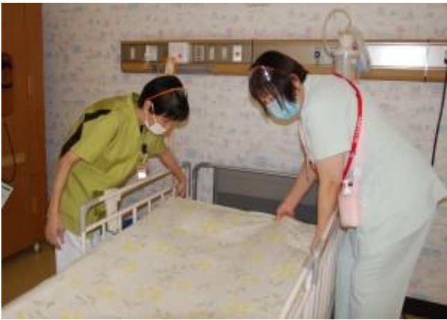
ベッドメイキング♪

病床周辺の清掃・整頓、シーツ交換やベッドメイキング、機械・器具類の準備や片付け 検査の伝票の処理や書類の整備などもあります