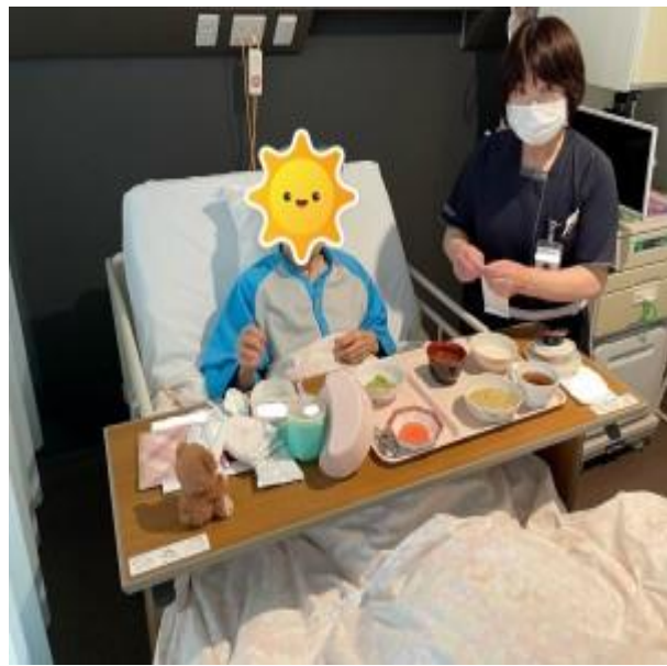
食べやすいようにお食事をセットします♪